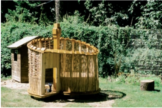
Die vorgefertigten Wandelemente sind montiert.