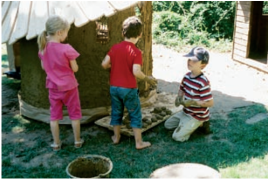
Aufbringen von handgeformten Lehmbröten.