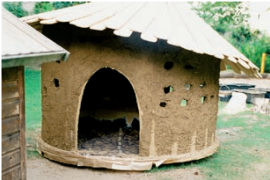
Die erste Lehmschicht trocknet in der Sonne.