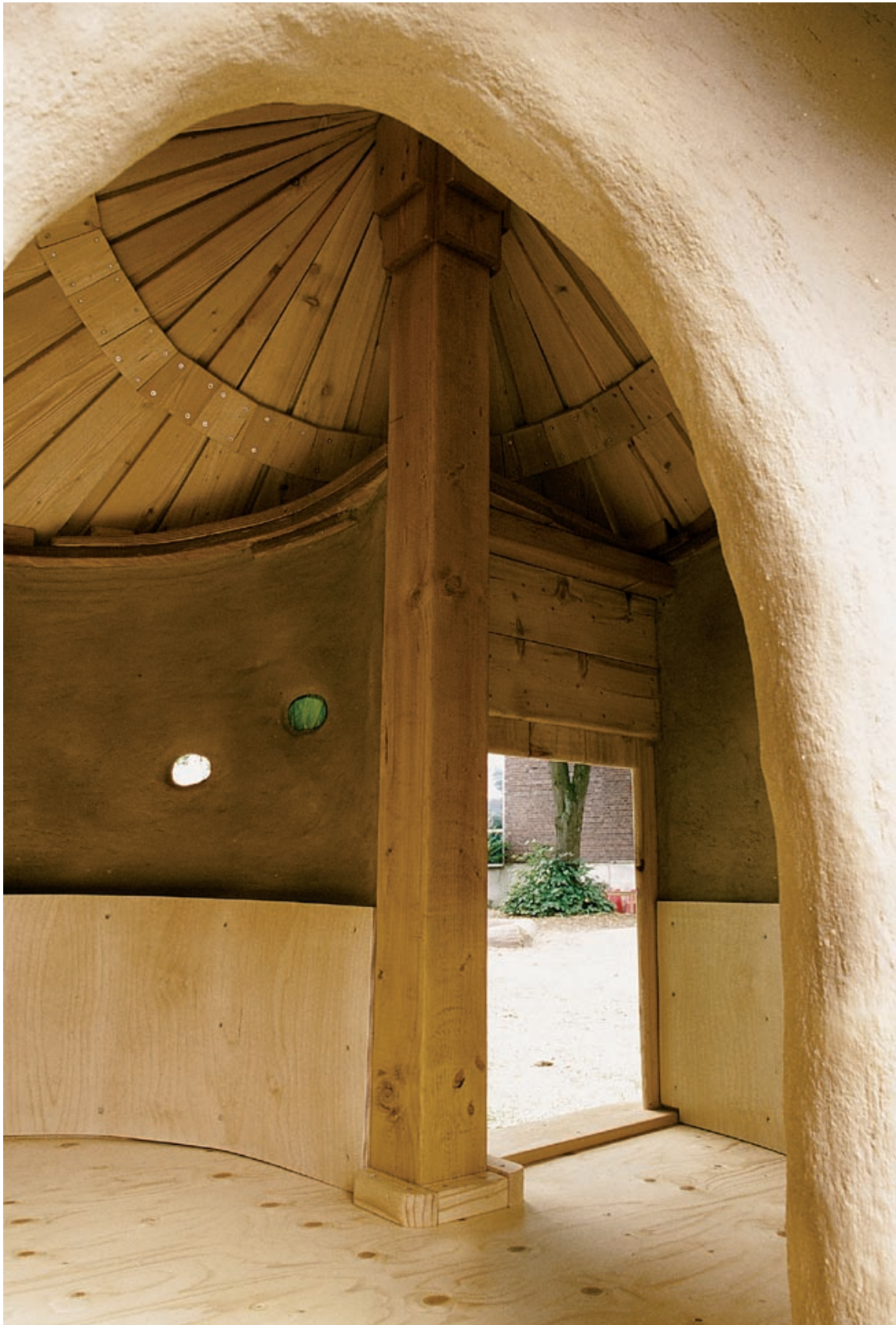
In der Lehmhütte haben bis zu sechs Kinder Platz.